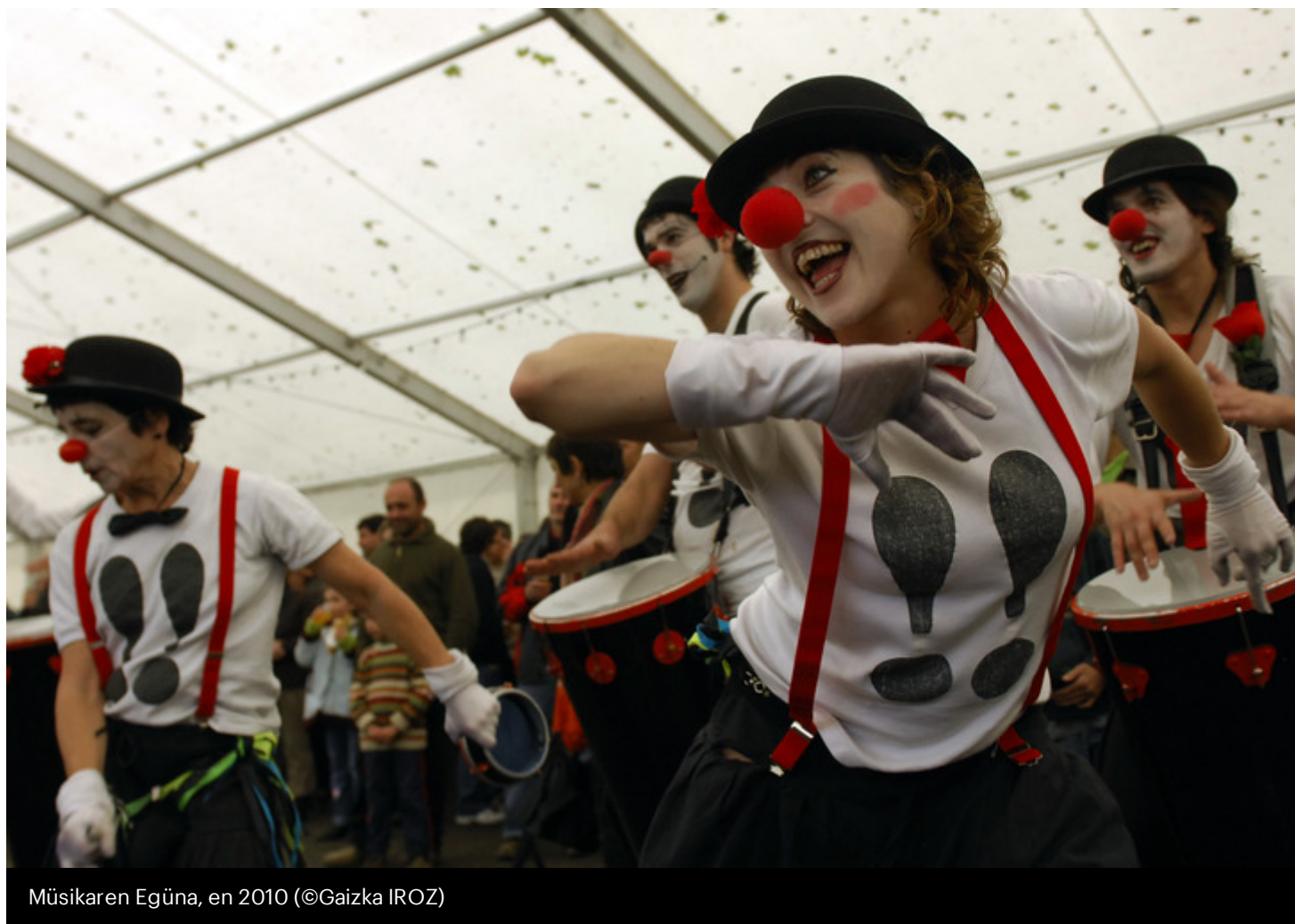
Müsikaren Egüna, en 2010

Du 22 au 24 mai prochain, la musique sera mise à l'honneur dans la commune souletine d'Ordarp, avec Müsikaren Egüna. Et cela dure depuis 26 ans.